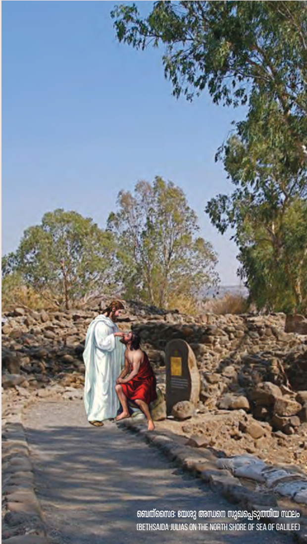
ബെത്സൈദ: ഛായുജ അസ്ഥന സുഖപ്പെടുത്തിയ സ്ഥലം (BETHSAIDA JULIAS ON THE NORTH SHORE OF SEA OF GALILEE)

അസ്ഥന സുഖപ്പെടുത്തുന്നു (മാർക്കോ . 8:22-26)