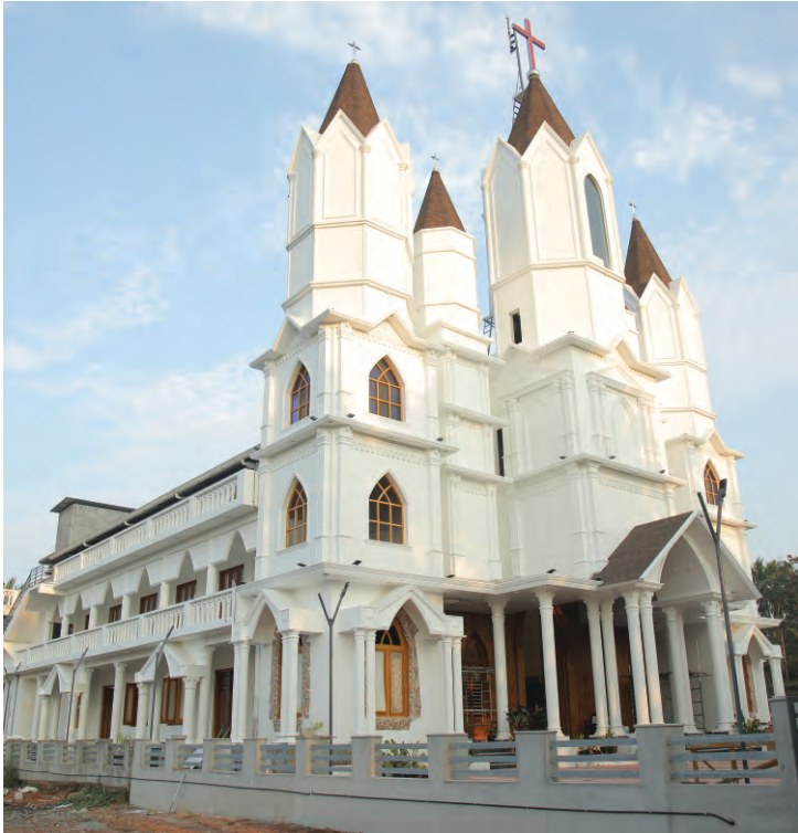
2022 ഡിസംബർ 25ന് ആശീർവാദവും പ്രതിഷ്ഠാകർമ്മവും നിർവഹിക്കപ്പെട്ട കൈപ്പറമ്പ് വിശുദ്ധ ഓർത്തോഡോക്സാ ദൈവാലയവും അംഗത്താരയും