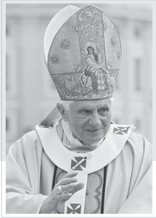
Pope Benedict XVI 1927-2022