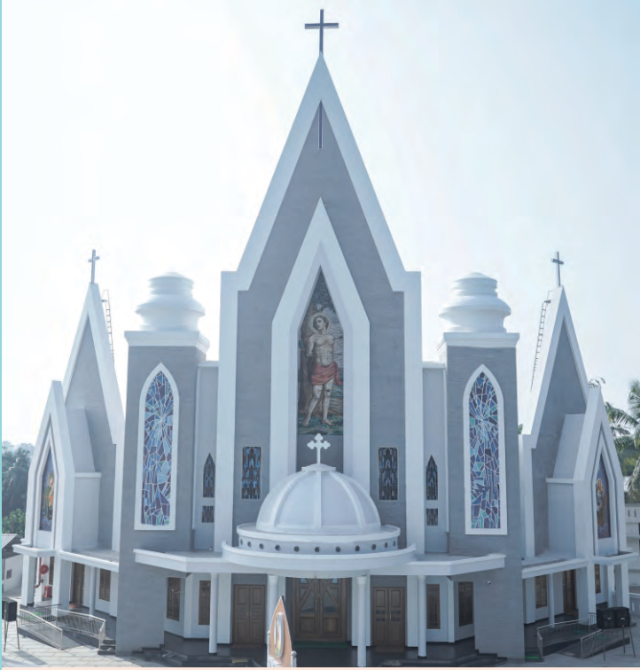
2023 ജനുവരി 01ന് ആശിർവാദവും പ്രതിഷ്ഠാകർമ്മവും നിർവഹിക്കപ്പെട്ട ആളൂർ സെന്റ് സെബാസ്റ്റ്യൻ ഇടവക ദൈവാലയവും അൾത്താരയും