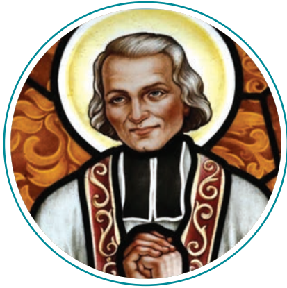
വി. ജോൺ മരിയ വിയാനി ഓഗസ്റ്റ് 04