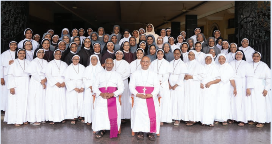
2024 ജൂലൈ 13ന് നടന്ന തൃശ്ശൂർ അതിരൂപതയിലെ സന്യസ്ത സുവർണ്ണ - രജത ജൂബിലി ആഘോഷിക്കുന്ന സമർപ്പിതരുടെ സംഗമം