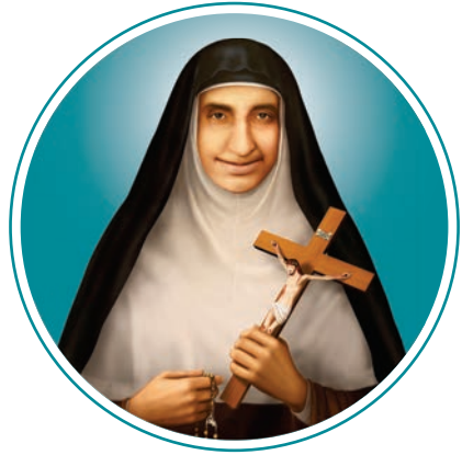
വി. ഏവുപ്രാസ്യ ഓഗസ്റ്റ് 29