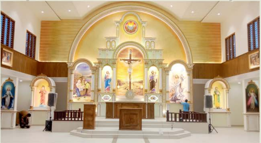
2024 സെപ്റ്റംബർ 08ന് ആശീർവാദവും പ്രതിഷ്ഠാകർമ്മവും നിർവ്വഹിക്കപ്പെട്ട ചുണ്ടൽ സെന്റ് തോമസ് ഇടവക ദൈവാലയവും അർത്താരയും