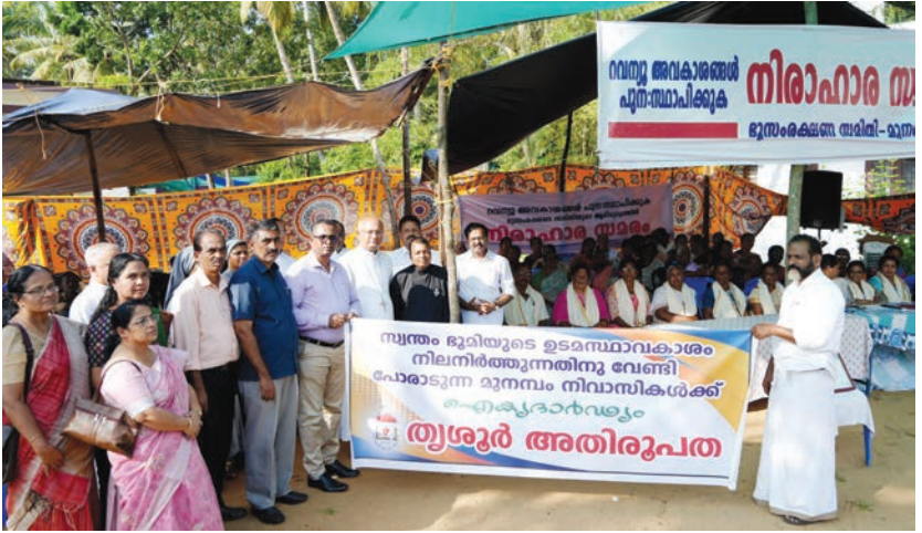
ഭൂസംരക്ഷണ അവകാശങ്ങൾക്കായി പോരാടുന്ന മൂന്നം നിവാസികൾക്ക് തൃശ്ശൂർ അതിരൂപതയുടെ ഐക്യദാർഢ്യം